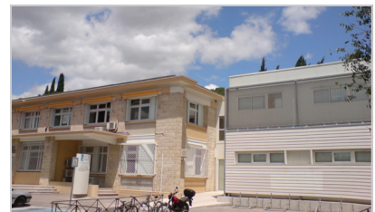
Siège Crous Montpellier

Après une période d'adaptation, que ce soit en interne comme auprès de quelques expéditeurs externes dubitatifs, il n'a plus du tout été question de problèmes de spam alors que c'était un sujet de mécontentement qui revenait tout le temps auparavant. Les utilisateurs sont très contents, leur ressenti se rapproche d'une grande sérénité, d'une impression de retrouver l'outil de courrier électronique comme ils avaient oublié qu'on pouvait en disposer. Car il est important de souligner que le système est d'une efficacité totale, efficacité qui semble aller de soi lorsqu'on étudie le concept en théorie, mais dont nous pouvons vous assurer que c'est le cas en pratique, après maintenant un an d'utilisation.